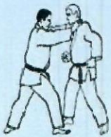
3. MAE DORI KUBI Saisie à 2 mains de face au cou