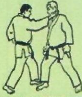
3. JODAN NANAME SHUTO Attaque en oblique avec le tranchant de la main