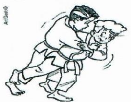
HARA-GOSHI BALAYAGE DE LA HANCHE