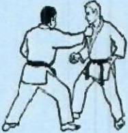
2. ERI DORI Saisie croisée du revers