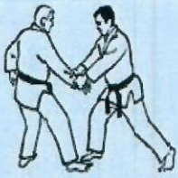
1. KATATE DORI Saisie du poignet à 2 mains