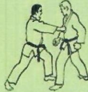
2. SHUDAN GIAKU TSUKI Coup de poing direct (plexus)