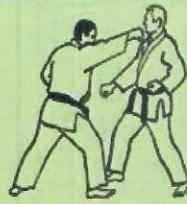
1. JODAN OIE TSUKI Coup de poing direct haut