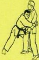
2. YOKO DORI Saisie de côté en ceinturant les bras